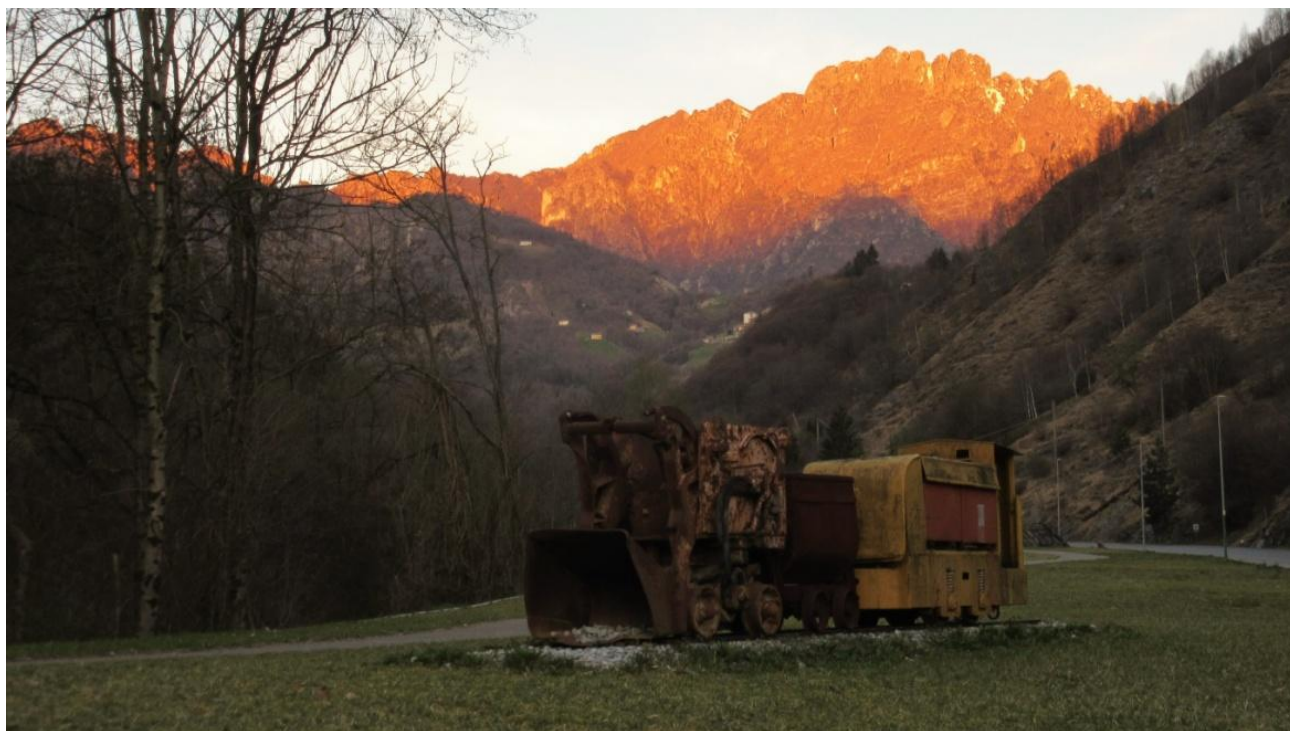
Alba sul Monte Alben, da cui sembra tragga il nome